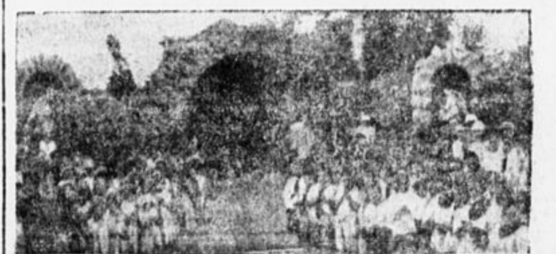
Священники в Америке собирают ребят у «святых пещер»

Се'езд польских скаутов, который откололся от скаутов и ва-