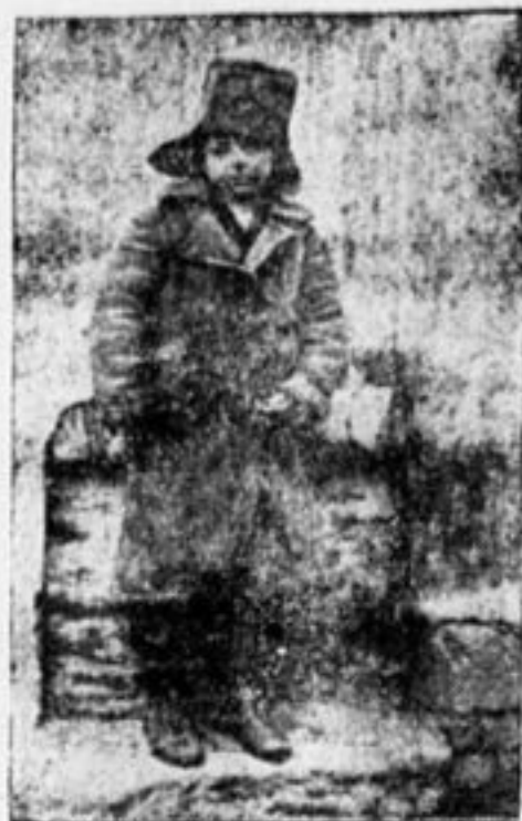
Втянули в наши ряды